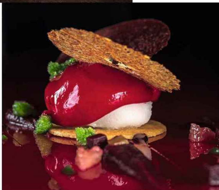
TABLE 100 % DESSERTS

Un menu composé exclusivement de plats sucrés, ou plus exactement de légumes et de fruits : il fallait y penser mais surtout avoir la virtuosité nécessaire pour faire défiler des sensations originales, savoureuses sans jamais être écœurantes. Le défi est relevé par le chef pâtissier Sébastien Vauxion , au Sarkara (« sucre » en sanscrit), deux étoiles Michelin, au sein de l'hôtel K2 Palace, à Courchevel. On commence par une entrée céleri-clémentine ou pamplemousse-betterave, puis un plat à base de pomme de terre ou d'oignon, pour terminer en apothéose par un citron et persil composé de crème aux zestes de citron, de sorbet citron-persil, de velouté de broccio corse et d'éclats de meringue. Une expérience étourdissante. Du mercredi au dimanche, de 13 h à 16 h.