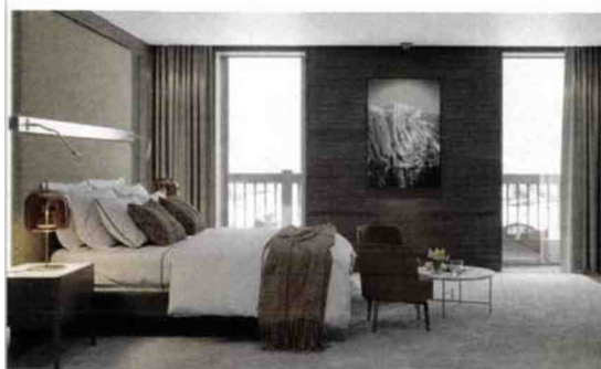
Le K2 Chogori à Val-d'Isère et le Lodji à Saint-Martin-de-Belleville : deux belles ouvertures au sommet.